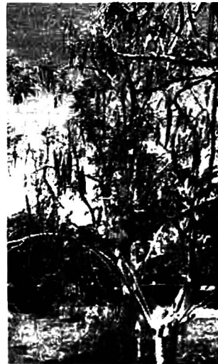
ต้นมะรุม

ในอดีต แม้จะมีตำราแพทย์แผนไทยและแพทย์แผนปัจจุบันได้ศึกษาสรรพคุณของส่วนต่างๆ ของมะรุมไว้มาก ไม่ว่าจะเป็นใบ ดอก ผัก เมล็ด เปลือก และรากก็ตาม แต่คนไทยส่วนใหญ่ที่ไม่ค่อยได้นำเอาส่วนต่างๆ เหล่านี้มาใช้ในชีวิตจริงกันเท่าไรนัก อาจด้วยความที่ไม่สนใจในสรรพคุณตามที่ระบุไว้ในตำรายาหนึ่ง หรืออาจจะเป็นเพราะไม่ทราบถึงรูปแบบของการใช้ (เช่น ต้ม ชง บด ฯลฯ) ที่แน่นอนอย่างหนึ่ง หรืออาจจะเกรงว่าบางส่วนของมะรุมจะมีพิษก็เป็นได้ ดังนั้นสรรพคุณที่ตำราเก่าๆ บรรยายไว้จึงไม่ค่อยเกิดประโยชน์ในชีวิตจริงของคนไทย เข้าทำนอง ‘ใกล้เกลือกินด่าง’ นั่นเอง โดยเฉพาะอย่างยิ่ง