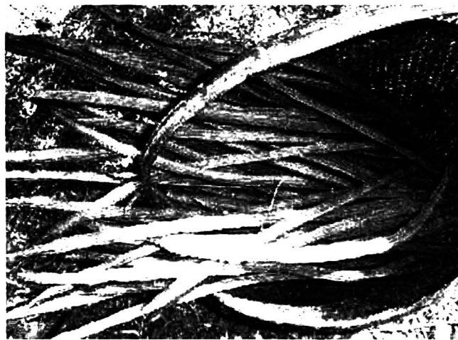
ฝักมะรุม

ออกจากเปลือก ผสมกับรสชาติของน้ำแกงที่มีรสเค็ม เปรี้ยว หวาน กลมกล่อม ทำให้มีแกงมะรุมไม่ลงไม่หนและทีเดียว